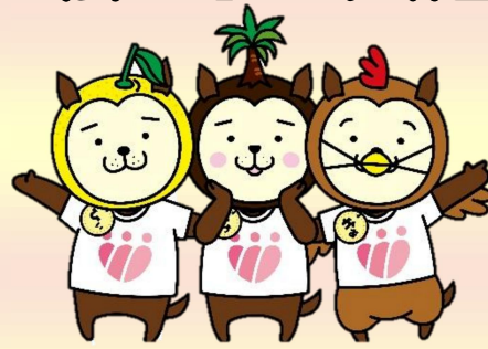
令和7年度 最優秀賞 受賞作品