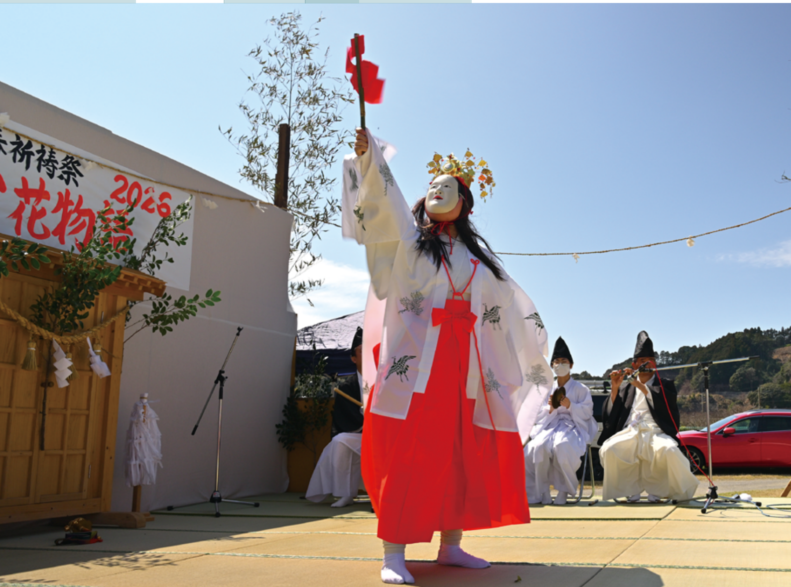
撮影地 川坂母子健康センター かわざか花物語2026