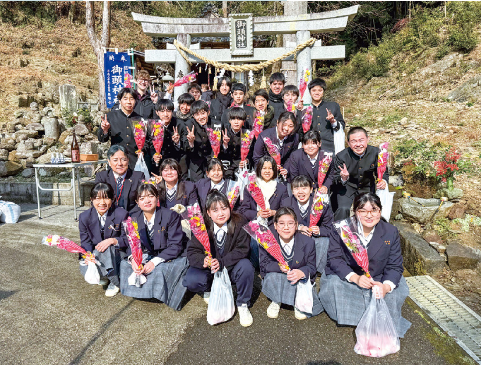
撮影地：北川町瀬口区御頭神社