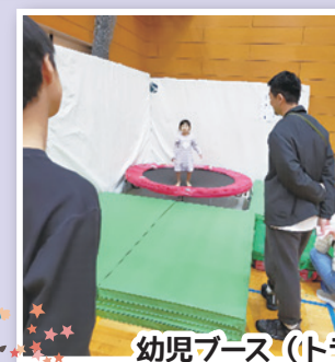
幼児ブース (トランポリン・ボールプール)