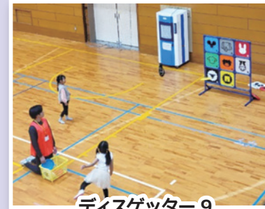
ディスクゲッター9