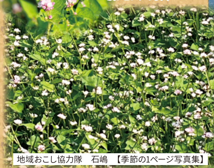
ミゾソバ(タデ科) 淡いピンクの小川...