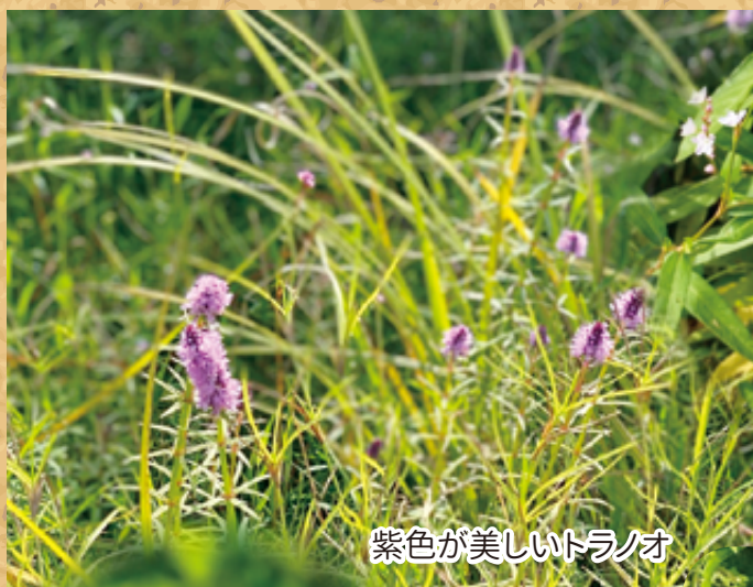
紫色が美しいトラノオ