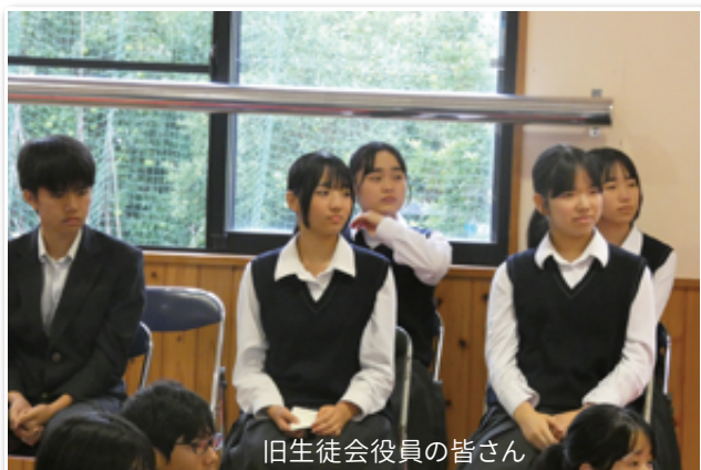
旧生徒会役員の皆さん

「家田湿原駐車場緑化プロジェクト」や「ホテル再生プロジェクト」が立ち上がりました。この貴重な経験を、それぞれの将来に生かしてくれることを願っています。今後は、新生徒会の皆さんがリーダーとして北川中を牽引していくことになります。公約の達成はもちろん、先輩方が築いたプロジェクトをさらに発展させ、ユネスコスクールとしての活動を深めていってくれることを期待しています。