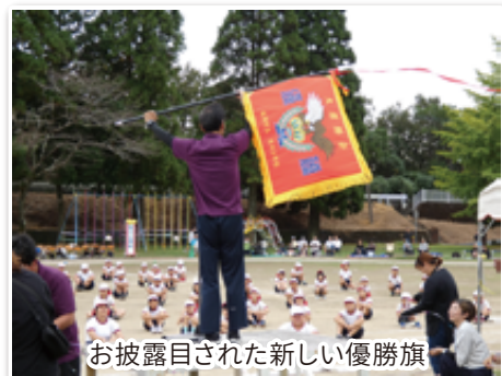
お披露目された新しい優勝旗

児童数が減少傾向ではありますが、この「全力で取り組む運動会」がこれからもずっと続いて欲しいと思います。