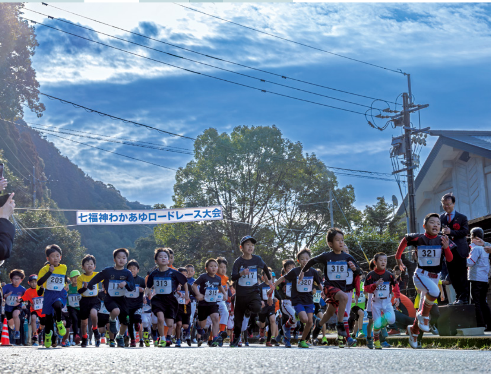
撮影地：北川総合運動公園