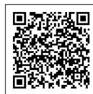
延岡市ホームページ