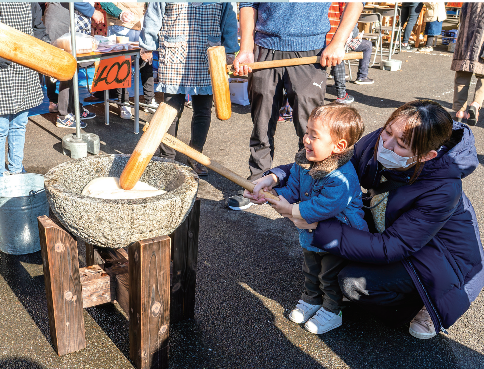
撮影地：北川総合運動公園駐車場（北川産業文化祭会場）