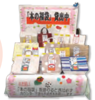
昨年の展示の様子です。

分館職員が、テーマ・年齢層ごとにセレクトした本が入った福袋を用意しています。 1袋に3～5冊入っています。 おせちもいいけど、読書もね!! ※数に限りがあります、お早めに!