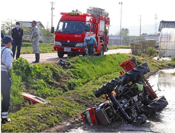
トラクター横転事故

これからは、秋の稲刈りなど農作業が多い時期となり、農業用機械を使う機会も多くなってきます。安全に作業をするために、機械を使う前の点検を必ず行って下さい。全国的にもこの時期、農作業による事故が多くなります。刈り払い機や乗用トラクターでの事故が多い傾向がありますので、使用時は特に注意をお願いします。農作業は不整地での作業が多く、不慮の転倒などでケガをする場合もありますので、作業時は、足場を確認し、無理をせず、きちんと休憩を取ることでも大切です。また、農林水産省の調べによると全国の農作業での死亡事故の約7割が65歳以上の高齢者によるものとの報告があります。今一度、安全な農作業を心がけましょう！