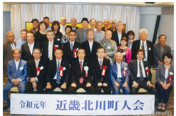
— 昨年の近畿北川町人会参加者の皆さま

なお、「近畿北川町人会」と「東京北川町人会」では、随時、新規会員の募集を行っています。近畿地方や関東地方にお住まいのご家族・ご親戚や知人の方がいらっしゃいましたら、ご紹介いただけると幸いです。ご入会希望は、地域振興課（電話46-5010）までご連絡ください。