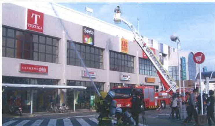
イオン延岡店で行われた、安全、安心なまちづくりのための防火訓練の様子

延岡新時代創生総合戦略における「雇用創出」、「移住・定住推進」、「結婚・出産・子育て支援」、「持続可能なまちづくり」の4つのプロジェクトを中心に、双方の資源を有効に活用した協働による活動を推進し、地域の一層の活性化および市民サービスの向上を図る。