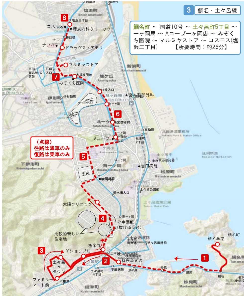
■ 鯛名・土々呂線 ルート（案）