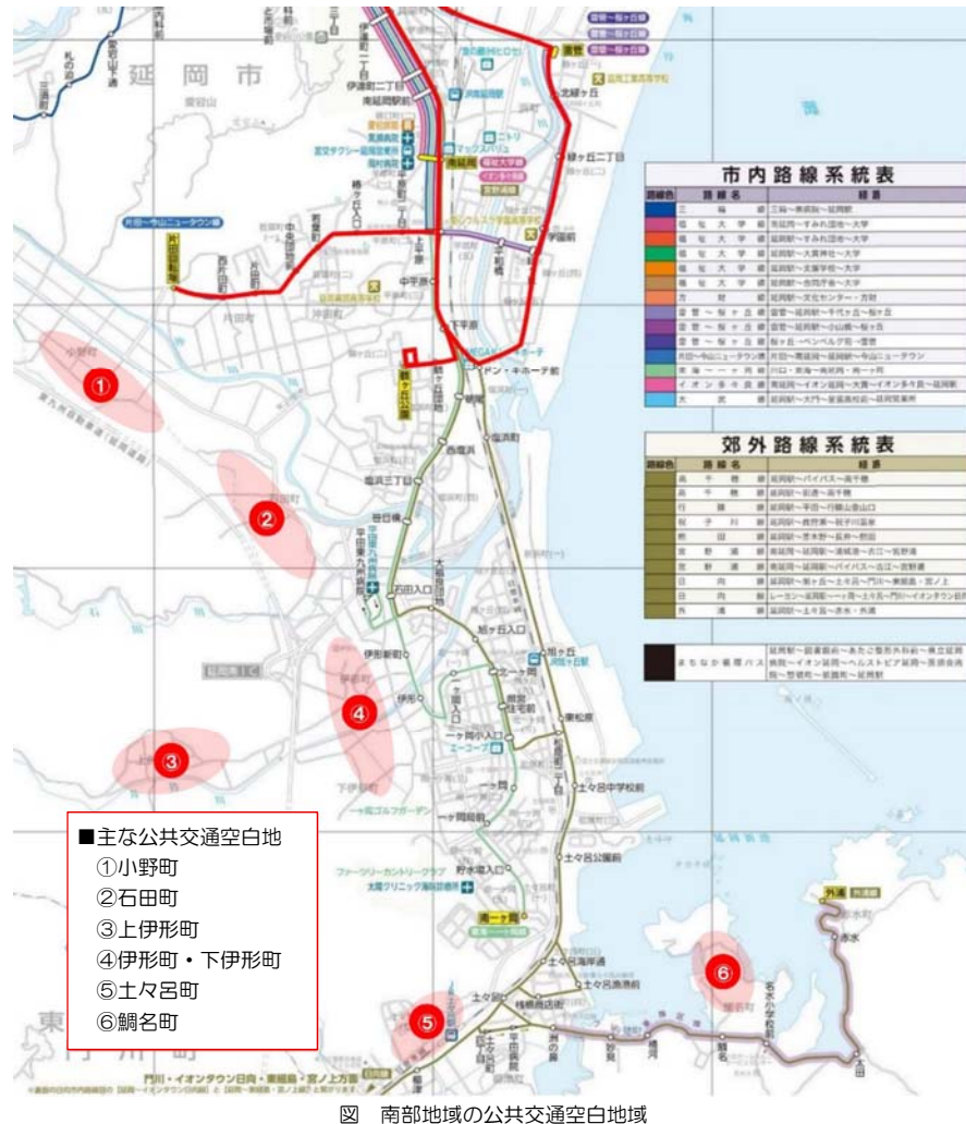
図 南部地域の公共交通空白地域

市街地北部・南部におけるまちなか循環バス実証運行の一環として、地域座談会を通じて地区内の交通問題や日常の外出状況などを把握したうえで、市街地縁辺部に点在する公共交通空白地のアクセス向上に資する地域交通の実証を行う。