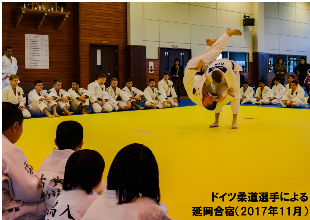
ドイツ柔道選手による 延岡合宿(2017年11月)