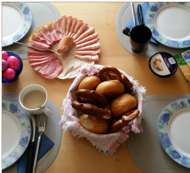
ドイツの朝ご飯（ロールパンやバターやランチョンミートやゆで卵など）