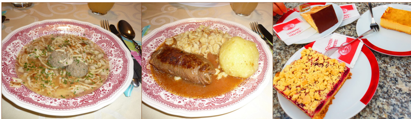
ドイツの料理はちゃんとコースに分かれています。

料理の大切さはドイツと日本では同じでしょうか？日本ではまちによって、名物の料理やお菓子がよくあります。（延岡市には名物が一つだけではなく、たくさんあります。）ドイツでは、ひとつのまちの名物より特定の地域の名物が多いです。もちろん市の名物もあり、例を挙げると、それはニュルンベルク・ブラートソーセージやドレスデン・シュトレンやリュベック・マジパンなどです。ミュンヘンでは、白いソーセージが人気ですが、バイエルン州のどのまちでも伝統的な料理の一つです。もう一つの南ドイツの料理はヴィナー・シュニツェル（ドイツ風とんかつ）ですが、「ヴィナー」はオーストリアのウィーン市という意味です。美味しい料理なら、国境も関係ありません。