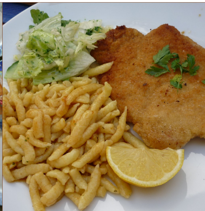
インディッシュと副菜が一皿に盛り付けています。（ヴィーナー・シュニッツェル）

Dass ich hier in Nobeoka wohne ist immer wieder eine Gelegenheit für Freunde von mir, die Stadt zu besuchen. Aber eigentlich gibt es auch genug andere Gründe, nach Nobeoka zu kommen. Zwar fehlen die „typisch japanischen“ Attraktionen – viele große und alte Tempel, Schreine und Burgen gibt es hier ebenso wenig wie das „hypermoderne“ Tokyo-Japan und auch der Schinkansen erreicht die Präfektur nicht – aber dafür hat Nobeoka schöne Strände, Berge, die perfekt zum Wandern und Bergsteigen sind, Wasserfälle, Flüsse mit unglaublich klarem Wasser und sehr, sehr viel gutes Essen. Und letzteres – Essen – ist diesen Monat das Thema des Newsletters! Und für alle deutschen Leser dieses Newsletters möchte ich noch einmal betonen: hier in Nobeoka gibt es wirklich gutes Essen! Kommt vorbei und genießt!