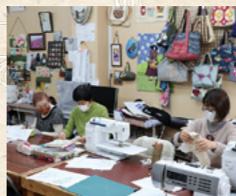
パッチワークの様子

「キルトの世界」展では、全国から募集した作品や、地元愛好家が共同で制作する「宮崎の神話」をモチーフにした大型作品などを展示します。全国から「みやざき」を