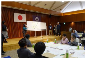
グループ発表の様子