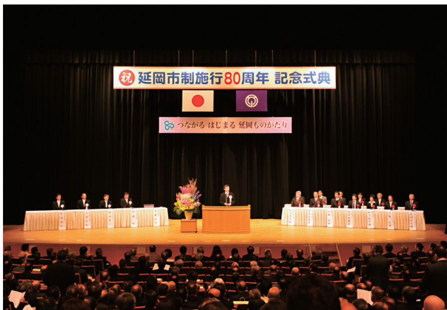
延岡市制施行80周年記念式典