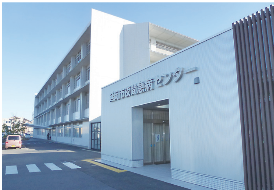
延岡市夜間急病センター