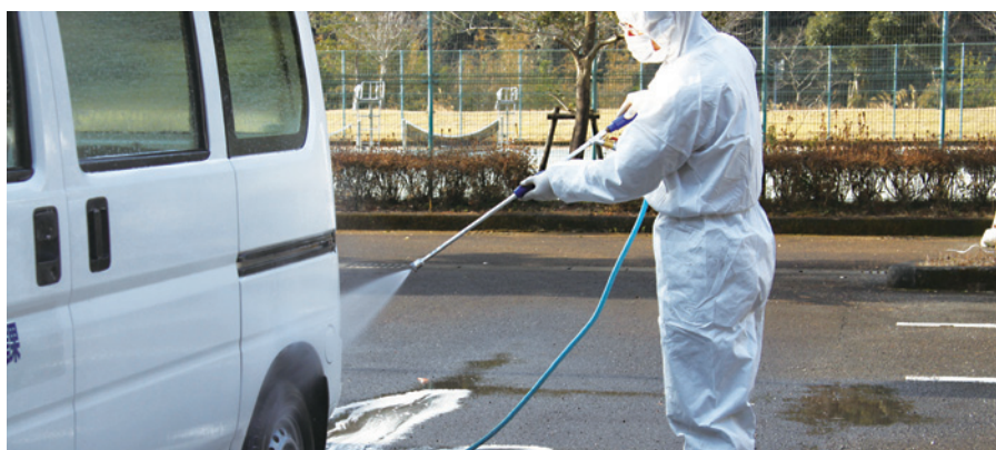
平成23年高病原性鳥インフルエンザ防疫作業