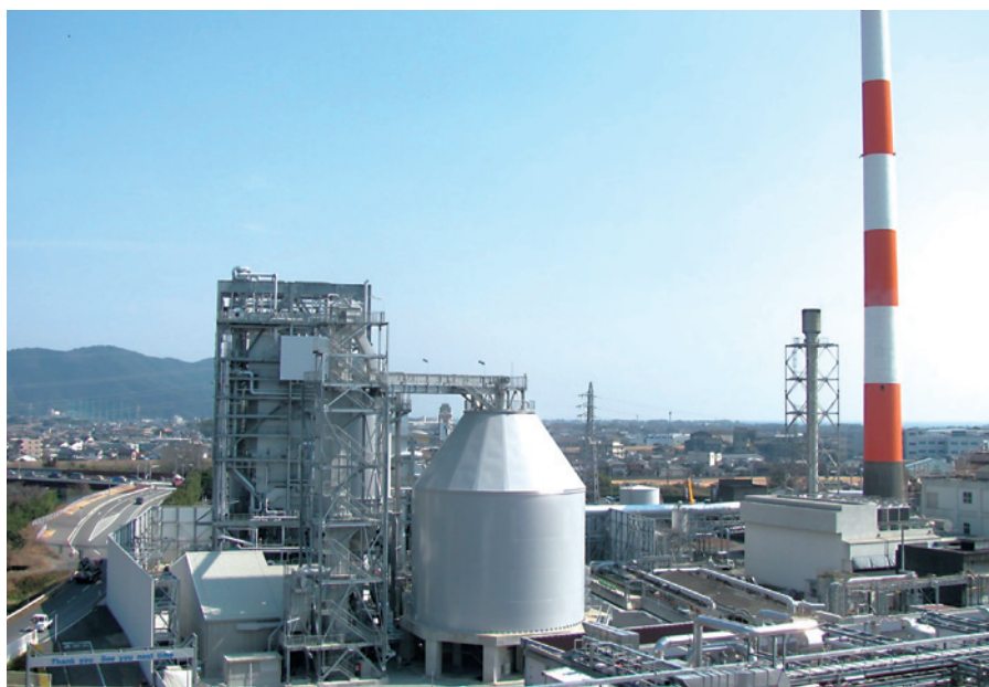
旭化成バイオマス発電所