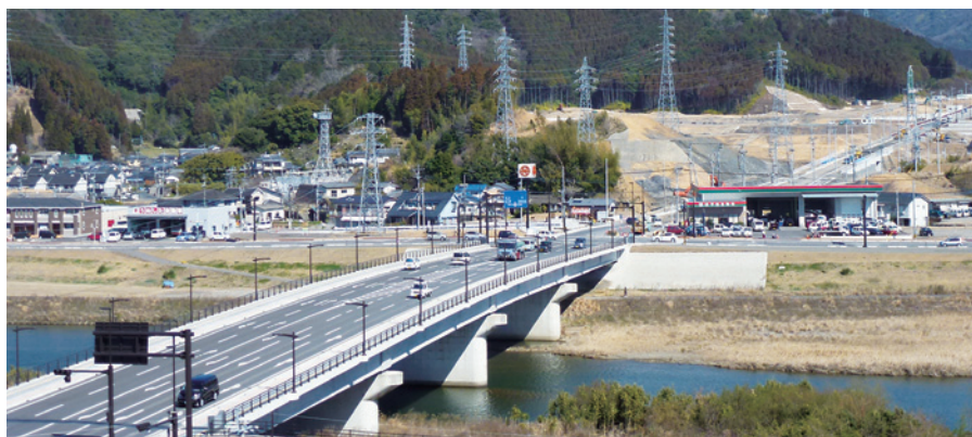
西環状線(五ヶ瀬大橋)