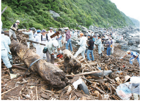
ボランティアによる海岸大清掃