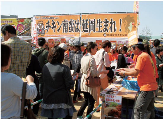
B1グランプリに参加したチキン南蛮党