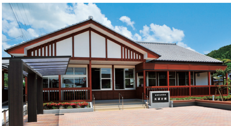
市立図書館北浦分館