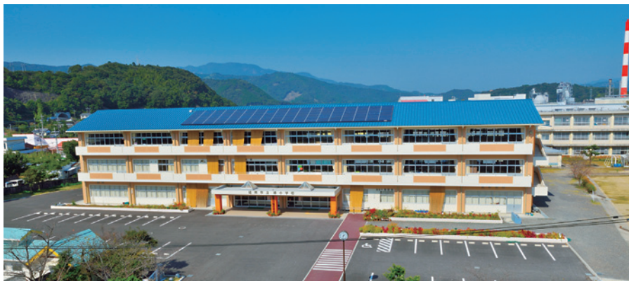
旭小学校校舎新增改築工事