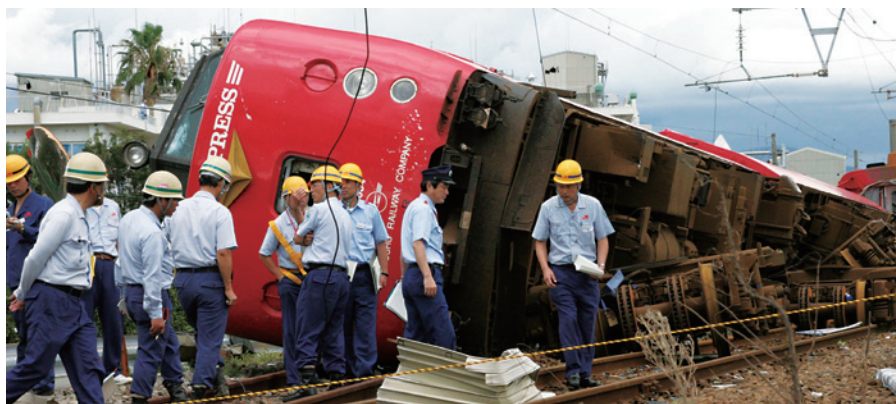
平成18年 台風13号竜巻災害