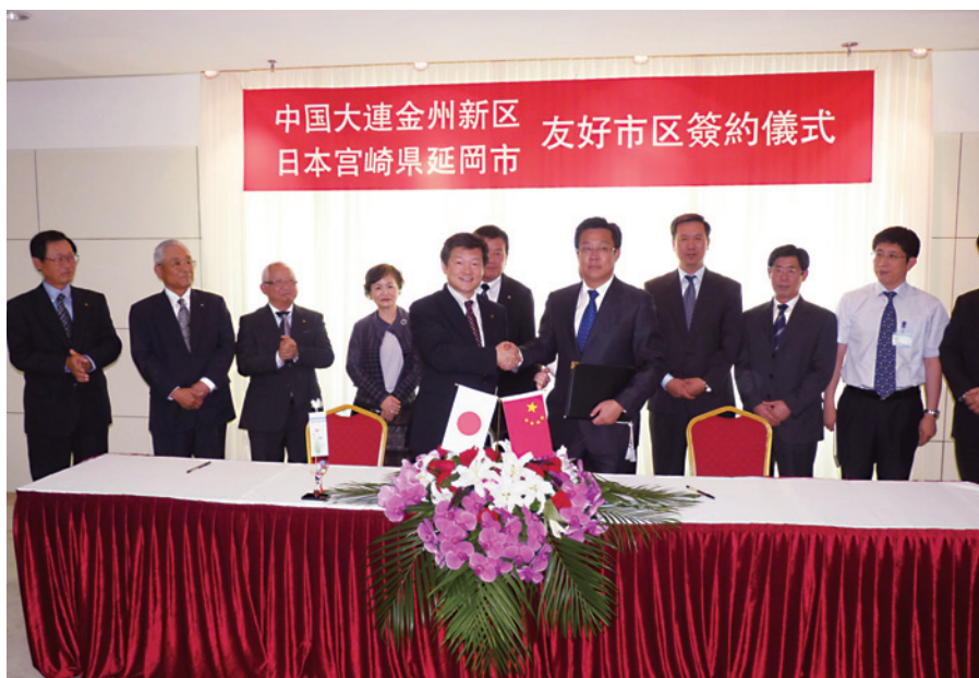
金州新区との友好都市の締結