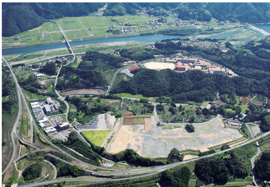
クレアパーク工業団地