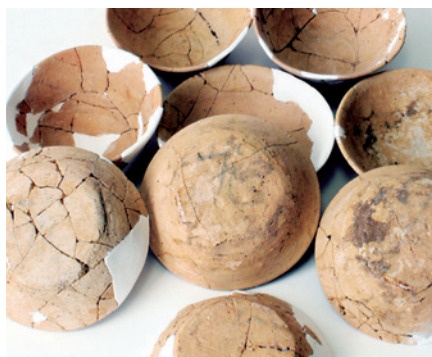
上多々良遺跡出土品(墨書土器)