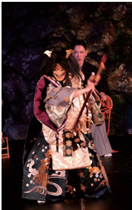
のべおか天下一薪能(船弁慶)