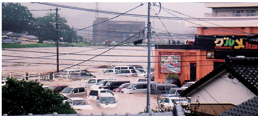
平成17年 台風14号による水害