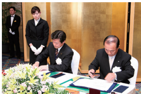
北川町との合併調印式