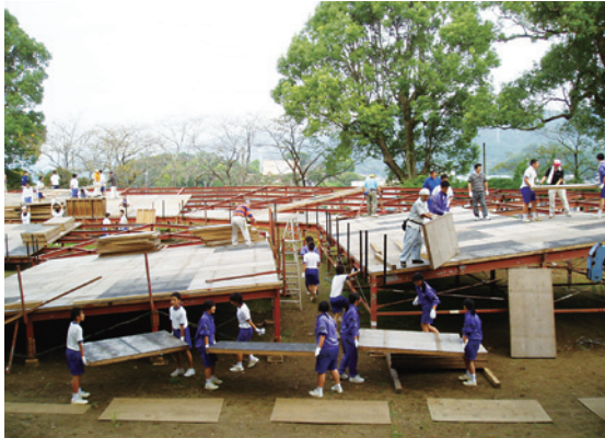
ボランティアによる薪能会場設営