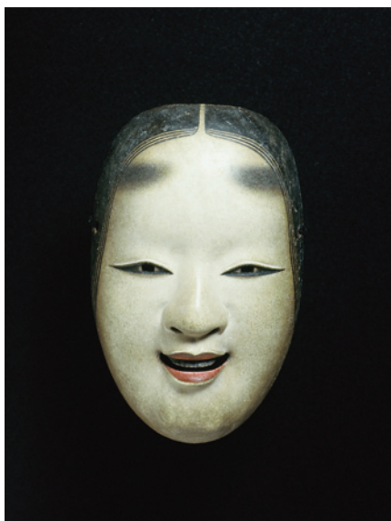
内藤家旧蔵能面(小面)