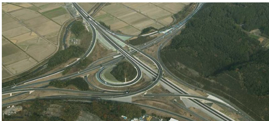
延岡JCT・IC付近