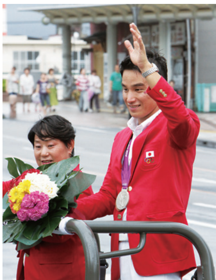
ロンドンオリンピックメダリスト (松田文志)