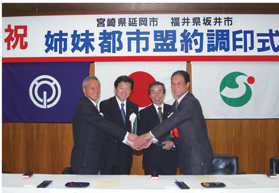
坂井市との姉妹都市盟約調印式