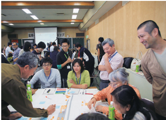
駅まち会議(駅まち市民ワークショップ)