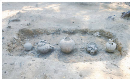
上多々良遺跡出土品(蔵骨器)