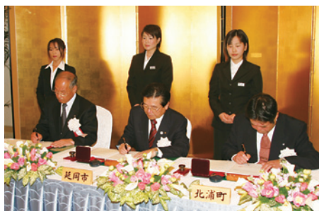
北方町・北浦町との合併調印式