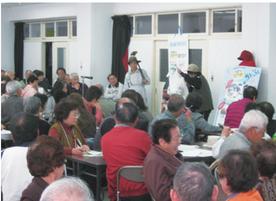
健康長寿市民運動