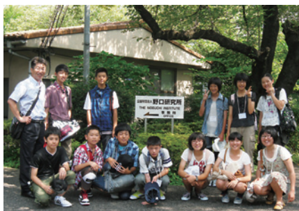
ジュニア科学者の翼