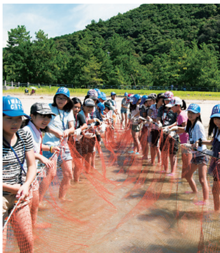
兄弟都市いわき市 (いわきジュニア交流)