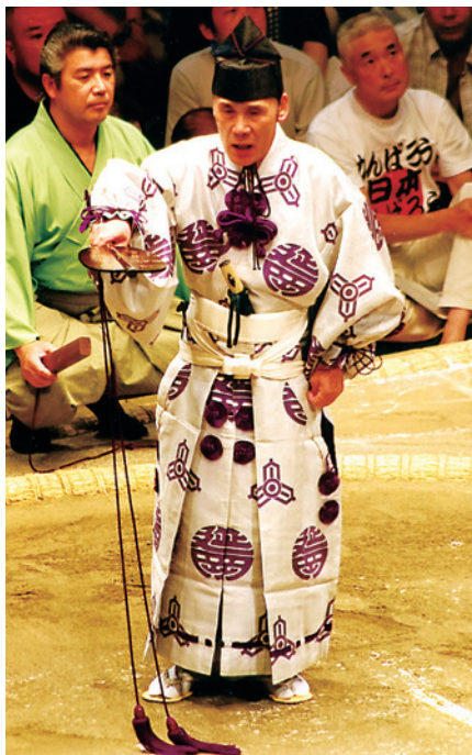
第35代木村庄之助 (内田順一)