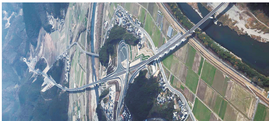
東九州自動車道 北川IC付近