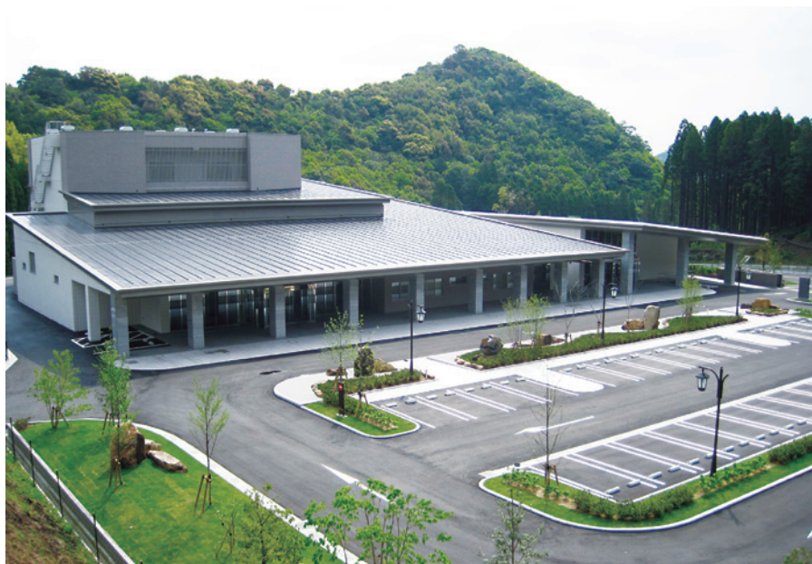
延岡市斎場「いのちの杜」