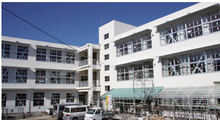
校舎の耐震化工事