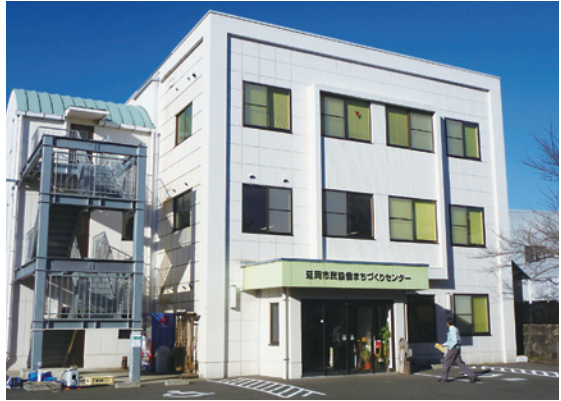
延岡市民協働まちづくりセンター