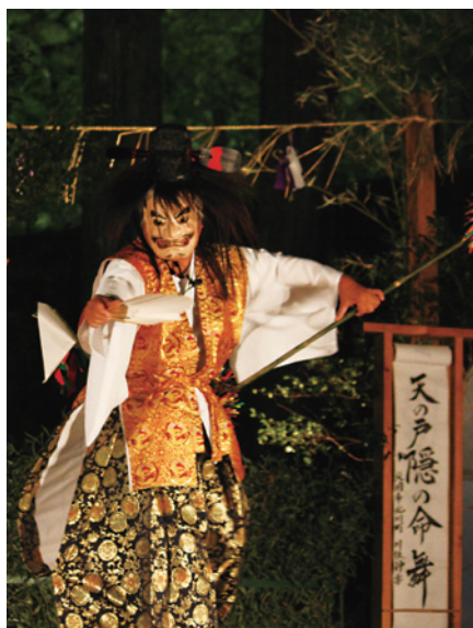
城山かぐらまつり