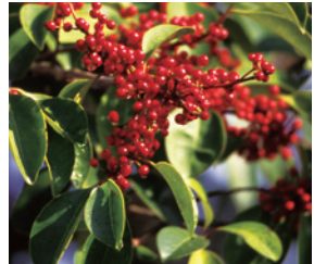
市の木 くろがねもち