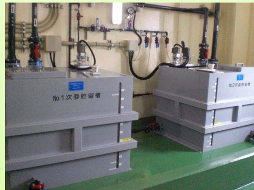
写真 1.4 消毒設備 (西階水源地)