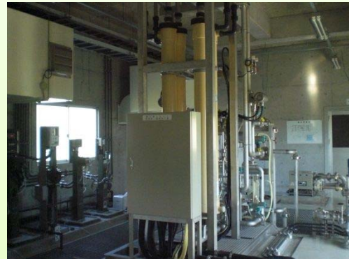
写真 1.2 膜ろ過設備 (須美江水源地)