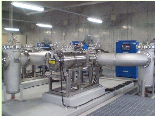
写真 1.1 紫外線設備 (三輪水源地)