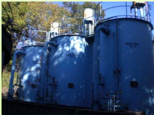
写真 1.3 急速ろ過設備 (荒平浄水場(下北方))