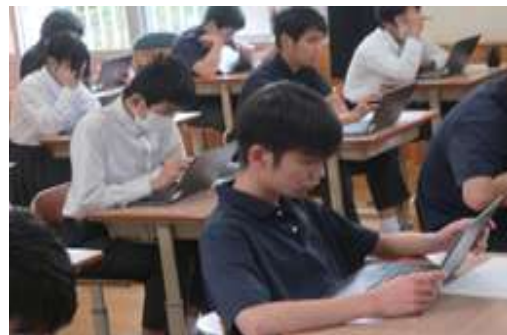
【真剣にタブレットPCで回答する中学3年生】

4月18日、今年度最初の参観日でした。小学1年生は初の参観授業でした。親子で問題に取り組みました。