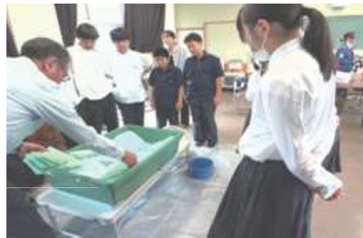
【ダムの模型を観察する中学1年生】

4月28日、中学1年生は、国土交通省流域治水課及び宮崎大学に協力いただき、流域の仕組みについて実際にダムや堤防の模型を使って説明をしていただきました。川の水をどう利用し、共生していけばよいのか考えるヒントとなりました。