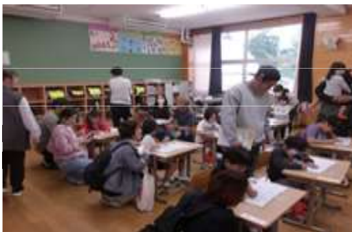
【熱心に親子で問題を考える小学1年生】