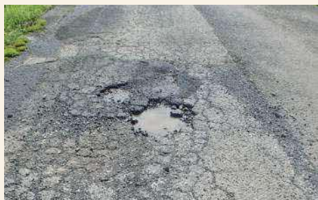
穴ぼこで危険な道路の例

産業建設課では、道路の安全確保のため定期的に点検を行っていますが、市道・林道・農道など広範囲に及んでいるため、細部まで目が届かないことがあります。危険な箇所を見かけた場合は、北方総合支所産業建設課土木係までご連絡をお願いします。