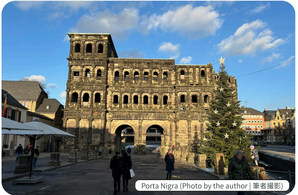
Porta Nigra

トリーアは、紀元前17年頃に初代ローマ皇帝アウグストゥスによって建設された、ドイツ最古の街とされています。当時、トリーアでなく、「トレウェリ族のアウグストゥス」という意味を持った名前、アウグスタ・トレウェロルムと呼ばれていました。こうしたローマ時代の影響は現在でも残っており、多くの歴史的な建造物や遺跡に見ることができます。その中、最も有名なのは世界遺産のポルタ・ニグラです。建設は西暦170年頃に始まり、最終的に完成されなかったにもかかわらず、当時市壁に囲まれていたトリーアの北門として使われていました (ポルタ・ニグラはラテン語で