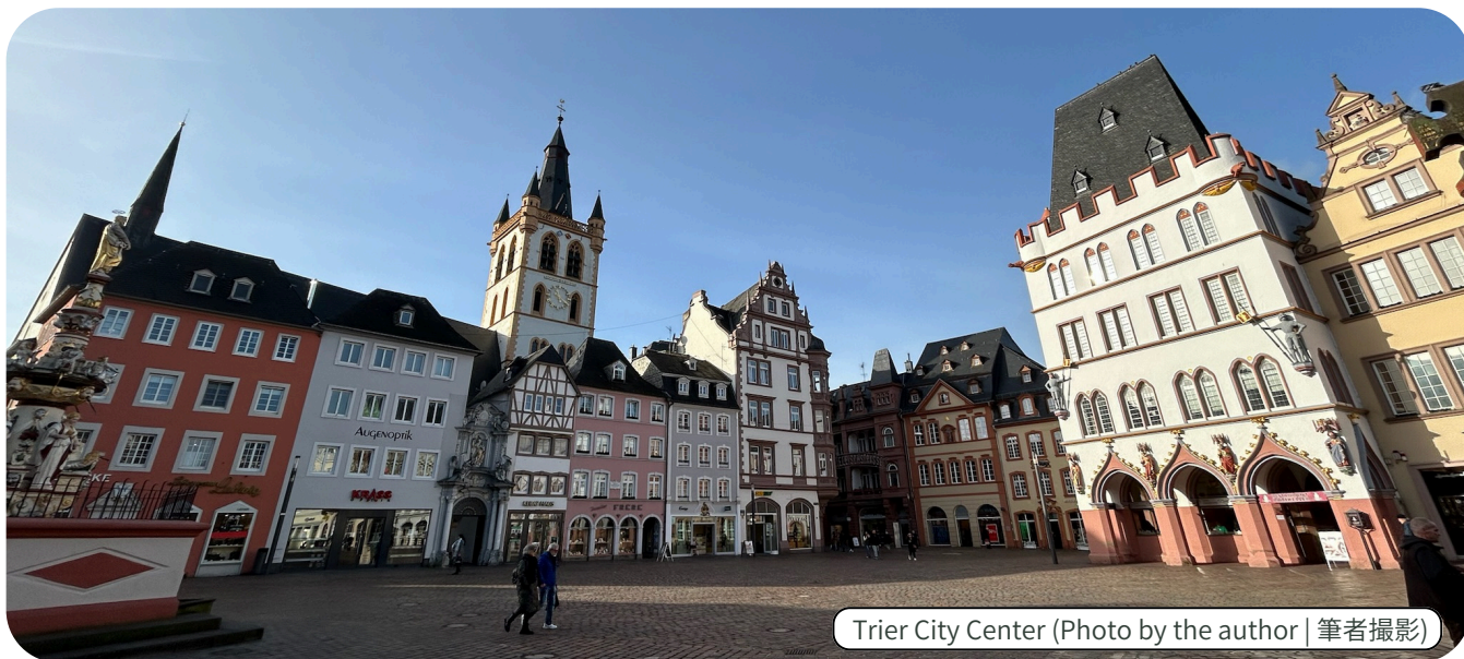
Trier City Center

4月とは、新しい年度とともに、沢山の 変化が訪れる時期：卒業、新しい人、新し い職場、様々なことが変わっていると思 います。ルーティンから抜け出すのはわくわ くする一方、疲れる気持ちもあります。そ の中で、花見の季節や良い天気を楽しみな がら、段々新しい環境に慣れてきたでし ょうか。今月の国際交流ニュースレターで は、私の出身地であるドイツの トリーア市 について紹介したいと思います。