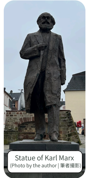
Statue of Karl Marx

There is much more to know about Trier, so I will continue the introduction in one of the upcoming Newsletters as well as expand on other topics related to Trier and the general region.