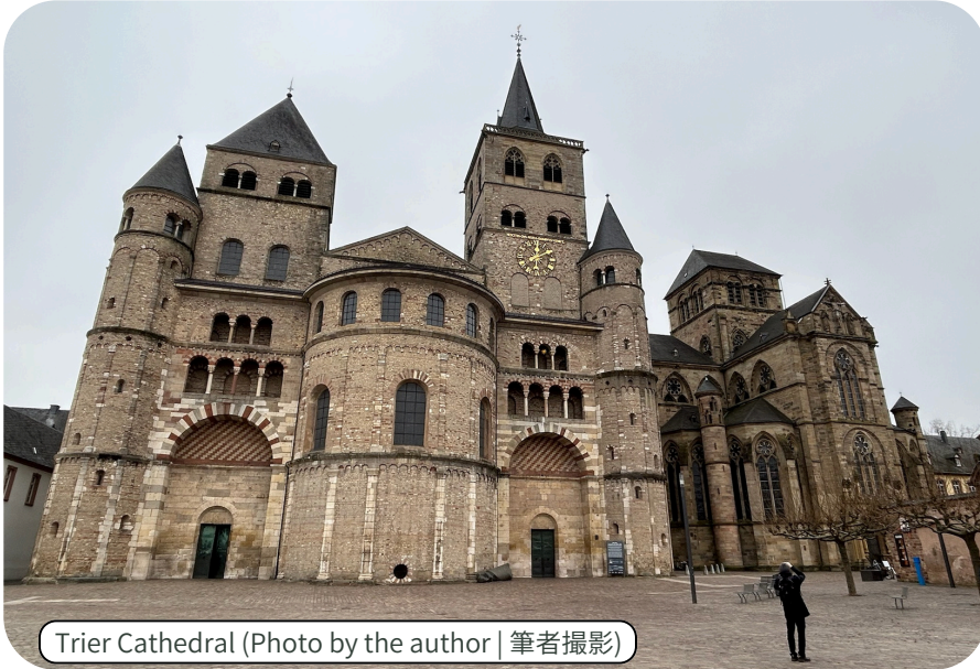
Trier Cathedral

「黒い門」)。現在のトリーアでは市壁はありませんが、その北部の門、ポルタ・ニグラはまだ立ち続け、世界中の多くの観光客を魅了しています。