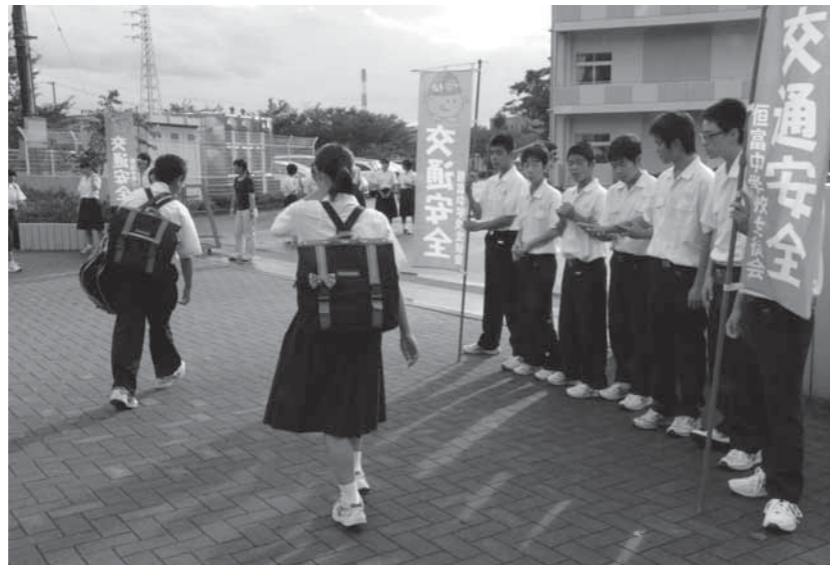
生徒会と各部活動が中心となって行う「朝のあいさつ運動」

するなど、活発な討論が行われました。生徒会ではほかにも、朝のあいさつ運動にも取り組んでいます。 あいさつ運動は、生徒会役員とバスケットや野球、テニス、サッカーなど11の部活動が交代で校門に立ち、登校する生徒に声掛けを行っています。