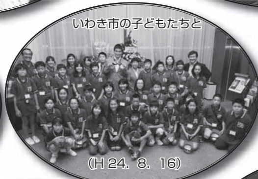
いわき市子どもたちと