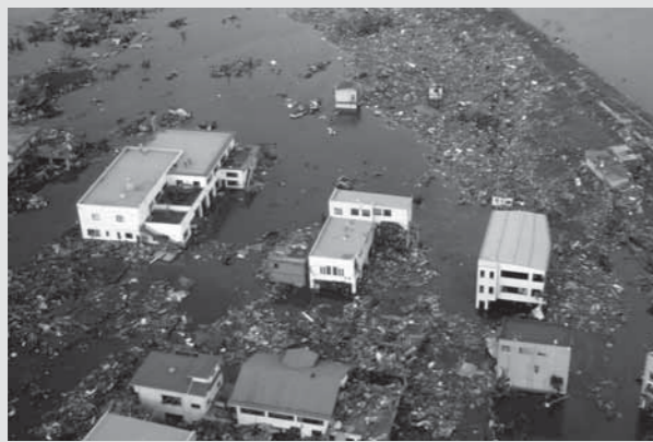
平成 23 年 3 月 12 日 金石市上空より

写真は、東日本大震災直後の平成 23 年 3 月 12 日金石市の上空から、救助の際に撮影されたものです。津波被害の甚大さとともに、押し寄せた海水が引いていないことが見てとれます。