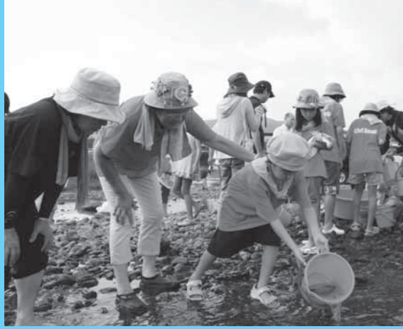
リバーフェスタ (8/12) では安全な水遊びの方法を学んだり、稚魚の放流などを行いました