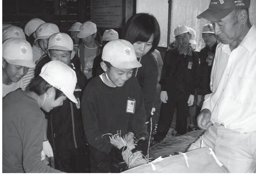
諸塚村での宿泊体験