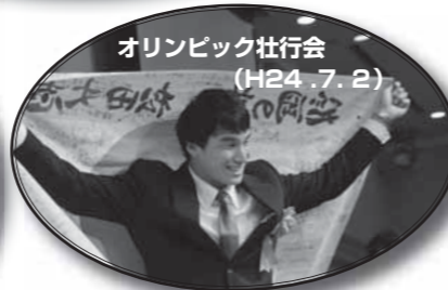
オリンピック壮行会 (H24.7.2)