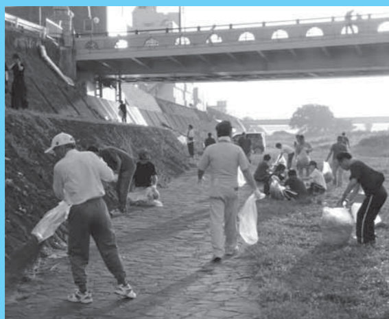
延岡発祥の「橋の日まつり」(8/4) ではイベントに先駆け、河川敷の清掃を行いました

日ごろから、河川流域での生活排水対策の推進や上流域での植栽、河川パトロールなど、河川を大切に作るさまざまな取り組みの積み重ねが今回の結果につながりました。