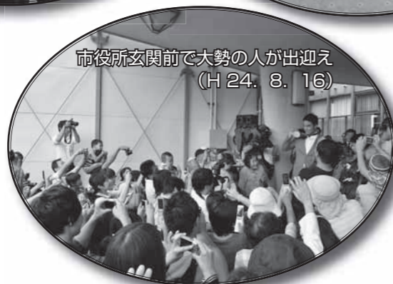
市役所玄関前で大勢の人が出迎え (H24.8.16)