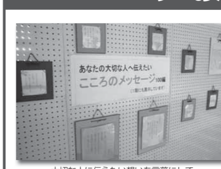
大切な人に伝えたい想いを言葉にして