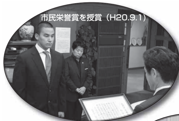
市民栄誉賞を授賞 (H20.9.1)