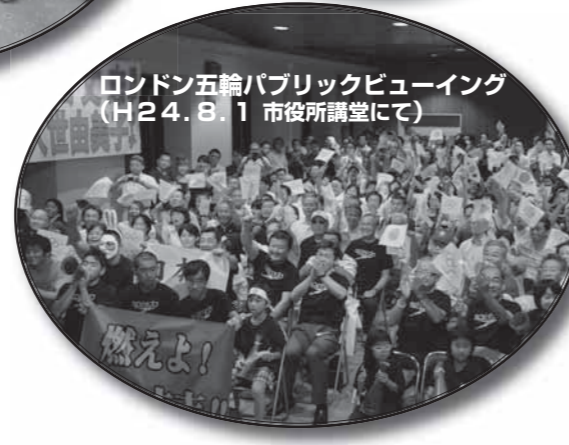
ロンドン五輪パブリックビューイング (H24.8.1 市役所講堂にて)