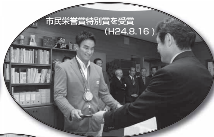
市民栄誉賞特別賞を受賞 (H24.8.16)