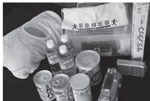
非常持出品の用意は迅速避難への「第一歩」