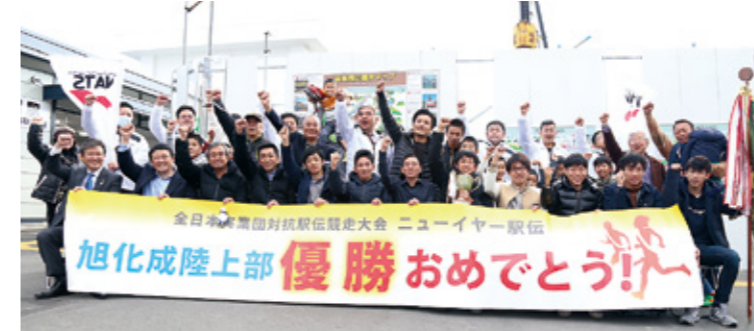
古豪復活！旭化成陸上部が大活躍！

旭化成株式会社から市に、野口記念館の建て替え 資金として、30億円の寄附をいただきました。 野口記念館は、昭和30年に同社の創業30周年を 記念し、寄贈していただいた施設です。 新しい施設は、平成34年の完成を目指します。