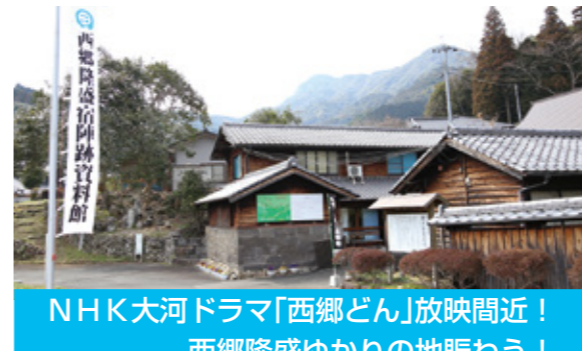
NHK大河ドラマ「西郷どん」放映間近！ 西郷隆盛ゆかりの地賑わう！

11月1日から、マイナンバーカード（個人番号 カード）を使い、全国のコンビニエンスストアに設 置されているマルチコピー機から、住民票などの各 種証明書を取得できるサービスが始まりました。