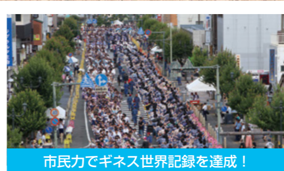
市民力でギネス世界記録を達成！

クリアパーク延岡工業団地第2工区に、4社の立 地が決まりました。 3月：有限会社桐木工作所、5月：富士チタン工業 株式会社、10月：株式会社中国工業所、11月：株 式会社三井