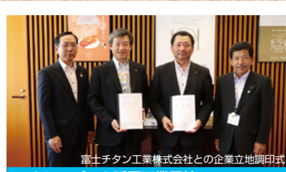
富士チタン工業株式会社との企業立地調印式 クリアパーク延岡工業団地 新規企業の立地が続々と決まる！

第99回全国高等学校野球選手権大会に、聖心ウ ルスラ学園高校が宮崎県代表として出場しました。 1回戦では、早稲田佐賀高校（佐賀県）に5対2 で勝利。12年ぶり2度目となる夏の甲子園で、見事 初勝利を収めました。