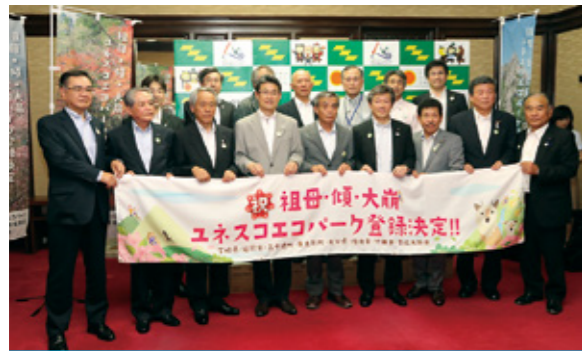
祖母・傾・大崩ユネスコエコパーク 登録決定

6月14日に「大崩山を含む祖母傾山系と周辺の 地域」が、ユネスコエコパークに登録されました。 豊かな自然や地域の伝統文化をはじめとした人と 自然との共生が世界に高く評価されました。