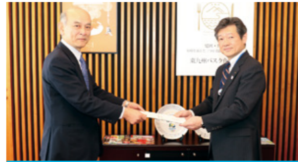
旭化成株式会社が市に30億円を寄附 野口記念館の建て替え決まる！

2017年も残りあとわずか。 今年、元日から嬉しい話題があり、 明るいスタートを切った年でした。 ここでは、主な出来事を写真とともに 振り返ります。