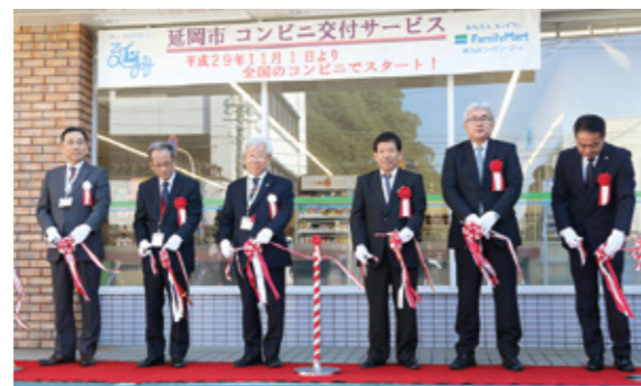
コンビニ交付サービスがスタート！ 市民の皆さんの利便性が向上

6月14日に「大崩山を含む祖母傾山系と周辺の 地域」が、ユネスコエコパークに登録されました。 豊かな自然や地域の伝統文化をはじめとした人と 自然との共生が世界に高く評価されました。