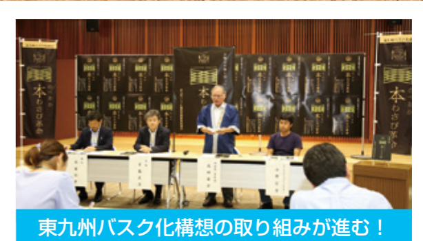
東九州バスク化構想の取り組みが進む！

7月に開催された第41回まつりのべおかで、ギ ネス世界記録「最多数で踊る盆踊り」に挑戦。 新ばなば踊りを間違えずに5分間踊り続け、見事、 2,748人で記録を更新しました。 また、この挑戦では、「一つの会場内で浴衣を着 た最多数」としてもギネス世界記録として認定さ れました。