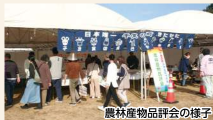
農林産物品評会の様子

11月8日(土)、北方総合運動公園で開催された第1回干支の町フェスティバル「ETO FES」で、農林産物品評会が開催されました。会場には北方町内で生産された果物や野菜など、品質の高い農林産物が多数展示され、多くの来場者が訪れていました。また、同会場で林業体験コーナーが開設され、家族連れが椎茸の駒打ちや木工を体験しました。