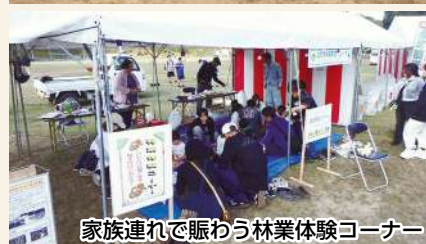
家族連れで賑わう林業体験コーナー