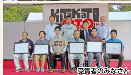
受賞者のみなさん