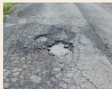
穴ぼこで危険な道路の例