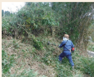
草刈り等による緩衝帯の整備

シカやイノシシ等による被害を防止するために設置しているワイヤーメッシュ柵は、その効果を持続させるために定期的な草刈りを行いましょう。