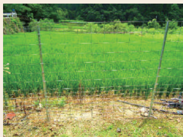
ワイヤーメッシュ柵の整備