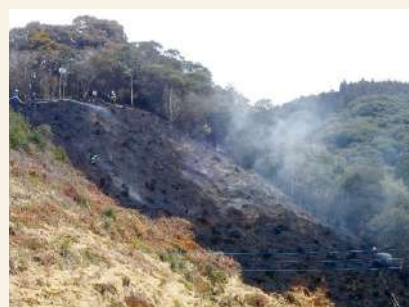
林野火災防止の徹底を！

たき火などの火気の使用中は、その場を離れず、使用後は完全に消火したことを確認するなど、林野火災防止の徹底をお願いします。