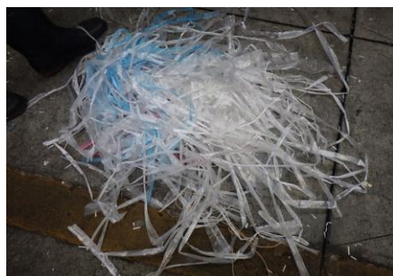
ビニールひも（廃プラスチック）