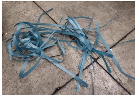
PPバンド（廃プラスチック）