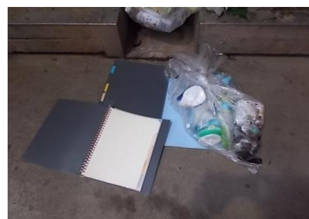
ファイル（廃プラスチック）