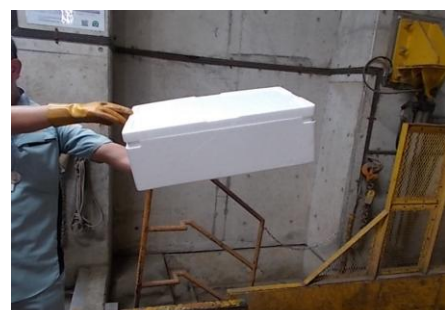
発泡スチロール（廃プラスチック）