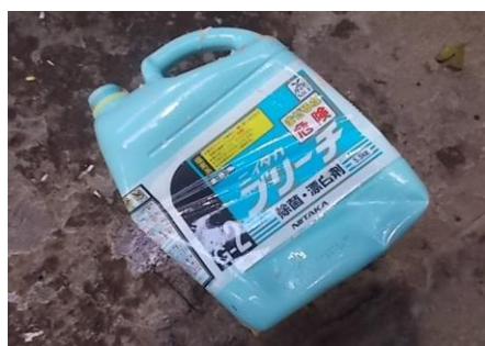
洗剤容器（廃プラスチック）