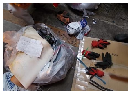
手袋（廃プラスチック）