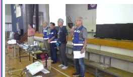
【6地区区長のあいさつ】

変更されたことや最近の大雨は、予想をはるかに超えることが多くなっていることを聞いて備えと避難の大切さを再認識しました。 次に、(有)旭ケミカルから非常食の説明を受けました。 最後に心肺蘇生方を実施して訓練を終了しました。