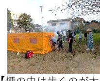
【煙の中は歩くのが大変！】