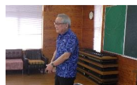
【挨拶する館山会長】

防災推進員から、地震・洪水について説明がありました。野田つつじ3区の地理的特性から、一定期間孤立する可能性があることや在宅避難に備えるためのポイントについて理解しました。次に、天下地区河川防災ステーション内に