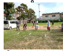
【すばやく初期消火】

はじめに、南海トラフ地震の30年以内の発生確率が変更されたことの説明を受け、その後防災クイズが行われました。クイズ形式で防災に対する知識を深めることができました。 次に、水消火器による消火訓練を実施。消火器の性能や操作法を学ぶことができました。 最後に煙中歩行訓練を実施しました。