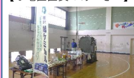
【(有)旭ケミカルの展示】