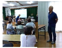
【木場会長と参加者】

また、ハザードマップから津波と洪水の想定浸水深が、ほぼ同じだと理解し防災講話を終了しました。