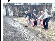
【火元に向けて発射】