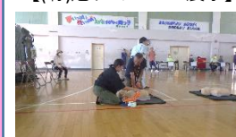
【バットの貼る位置を確認】