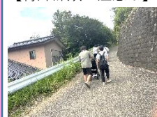
【本東寺まで避難中】