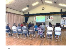
【早期避難は大切です】

その後、防災推進員から大雨時の早期避難や避難のタイミング、地区の特性について説明を受けました。 次に、水消火器による消火訓練を実施しました。消火器の放射距離と放射時間を確認することができました。最後に、煙体験ハウスで煙の中を歩く大変さを学びました。