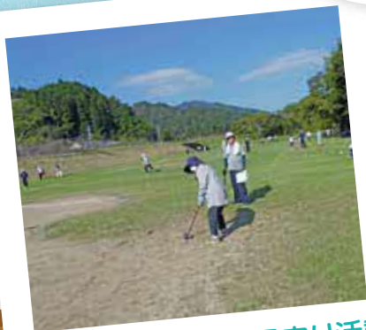
高齢者のふれあい・見守り活動

市広報紙の配布や区(自治会)の連絡及び防犯関係・地域のイベント等のお知らせを回覧板で情報提供しています。