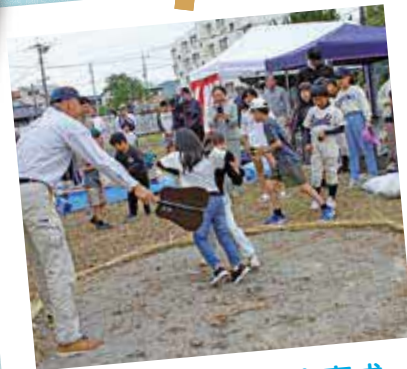
子どもたちの健全育成

学校、PTAなどとともに、子どもたちの健全育成に努めています。また、子ども会などと協力し、各種イベント等を開催しています。