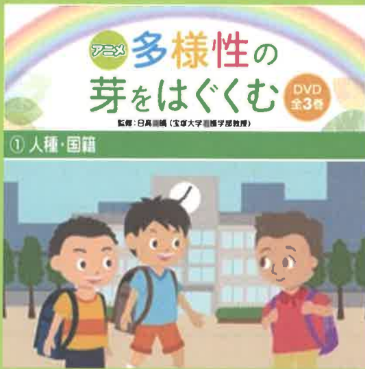
アニメ 多様性の芽をはぐくむ ①人種・国籍

宮崎県では、8月を「人権啓発強調月間」と定め、多くの県民の皆様 に人権について考えていただくための取組をおこなっています。 映画をみて、人権の大切さについて理解を深めましょう。