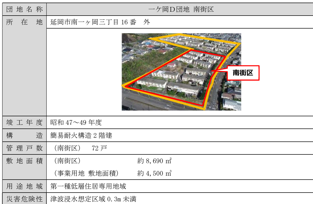
表 6-1 一ヶ岡D団地（南街区）の概要