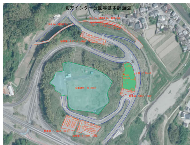
北方インター公園等基本計画図

冒頭、市長から半導体関連企業が熊本県に進出したことを受け、本市を含む九州内の企業においては、投資活動が活発になっており、熊本県と延岡市中心地を結ぶ九州中央自動車道の沿線にある北方インター公園は、インターが近くアクセスも良いことから最適地と考えられます。このことから、北方地域の経済・雇用にとって、若い人たちが働く場所ができる千載一遇のチャンスとなるので、計画を前に進めていきたいとあいさつがありました。