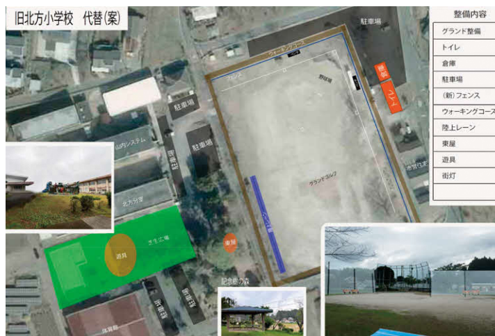
旧北方小学校代替 (案)