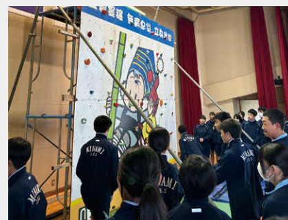
体験会の様子は 12/11 の タ刊デイリーにも掲載されました