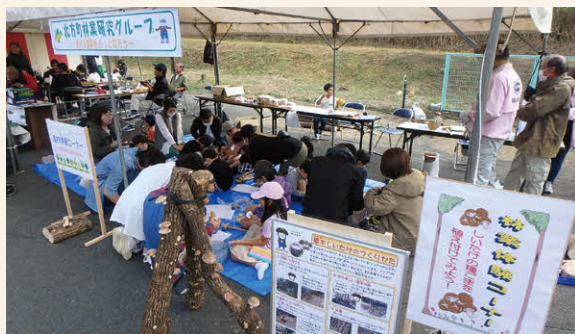
北方町林業研究グループの活動の様子

北方町の林業関係者で「北方町林業研究グループ連絡協議会（事務局：産業建設課農林係）」を組織し、これまで地元の地域振興イベント等で森林・林業啓発活動等を行ってきましたが、会員の高齢化も進んでおり、新規会員を募集しています。林業関係に就業されている方や林業に興味のある方は今後の林業振興に向けて一緒に活動しませんか？