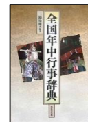
『全国年中行事辞典』

110年以上前にアンナ・ジャービスが起こした1つの行動は、母へ日頃の感謝を伝えるきっかけを私たちに作ってくれたのかもしれない。