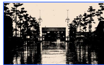
【奉迎門が建てられた延岡駅前】

昭和40年2月には鉄筋コンクリート製の駅舎としてリニューアルし、平成30年4月にカフェや書店、学習スペース等が延岡駅舎と併合した、現在の複合施設「エンクロス」がオープンしました。