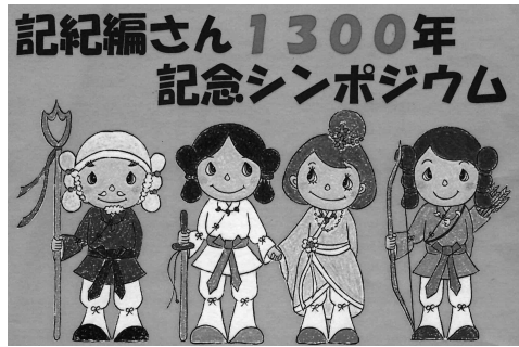
▲神々のマスコットキャラクター (左から) さるたん、にんにん、はなはな、ほーりー

【答】本市には、神話にまつわる史跡や地名、伝説などが数多く残されている。市民レベルでも「記紀編さん1300年延岡実行委員会」が発足し、先日は北川町にある宮内庁管理の二二ギノミコト陵墓参考地で川坂神楽の奉納が行われ、神々