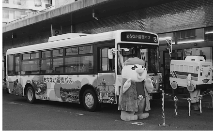
▲まちなか循環バス

【答】1カ月間の乗車人数は1591人、一日平均乗車人数は66人、時間帯別の乗車割合は8時台67%、9時台8.5%、10時台17.7%、11時台15.5%、13時台15.9