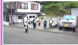
【一時避難場所に集合】

黒木会長があいさつした後、防災推進員による地震及び土砂災害の講話を受け、最後に非常持出品の確認を行い訓練を終了しました。