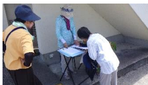
【暑さ対策バッチリよ】

延岡工業高校の生徒は、地震避難訓練や自衛隊訓練見学の後、リモート形式で学校周辺の危険見積りと地震・津波発生時の避難のあり方などについて学びました。