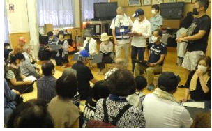
【多くの参加がありました】

防災推進員より身近にある日用品で準備をする非常用持ち出し品の考え方と防水処置について説明があり防災訓練を終了しました。本訓練では、小・中学生が訓練進行のサポートなど積極的に行ってくれました。