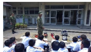
【人命救助セットです】