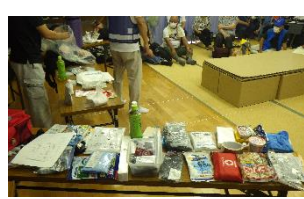
【市販品を自分流にアレンジ】