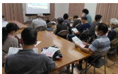
【熱心に聞いてます】

う」と挨拶があり、講話では、北川と祝子川の影響を受けやすい地理的特性がある事や災害により避難する場所が違う事などを改めて認識しました。津波避難ビルのオーナー様にも参加して頂き次回訓練への足掛かりとなりました。