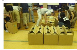
【段ボールベッド作成中】