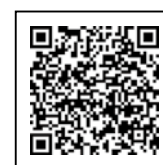
延岡市ホームページ