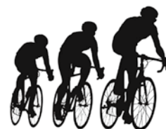
選手通過予想時刻

なお、主な地点の通過予想時刻については下記のとおりであり、特段の交通規制は行いません。