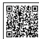
ウイズウェルネス