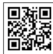
ホームページはこちら

ポイントの使用期限は1月31日（水）までです。使用期限後はポイントが消失しますので、お気をつけください。