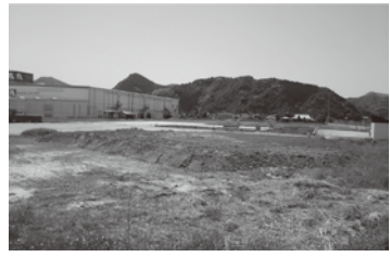
▲〔仮称〕延岡南分署建設予定地

【答】平成29年度に実施予定の地質調査及び実施設計の結果を踏まえ、平成30年度の整備完了を目指したい。