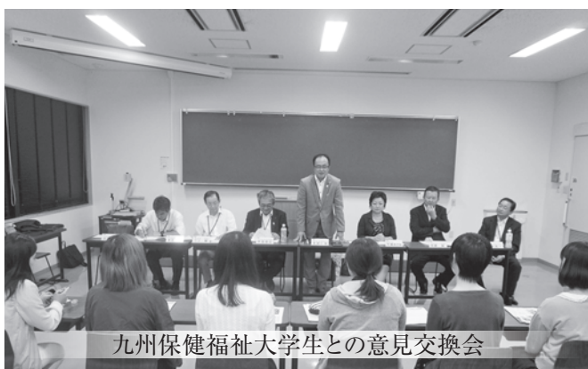
九州保健福祉大学生との意見交換会

市議会では、議会基本条例に基づき、開かれた議会の一環として、議会活動の内容を広く市民の皆様にご理解していただくために、議会活動報告会を開催しています。若い世代の意見を聞き、まちづくりの参考とすることや議会に親近感を持ってもらうことを目的として、昨年度より、九州保健福祉大学生と意見交換を行ってまいりました。今年度は、新たに高校生との意見交換を計画し、延岡商業高校生と意見交換を行い、市政について様々な意見が出されました。