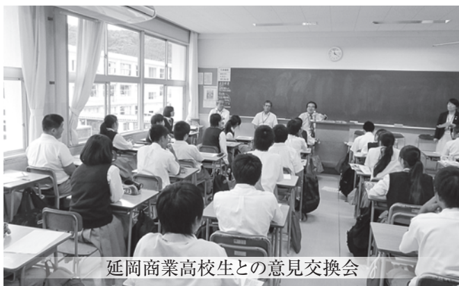
延岡商業高校生との意見交換会