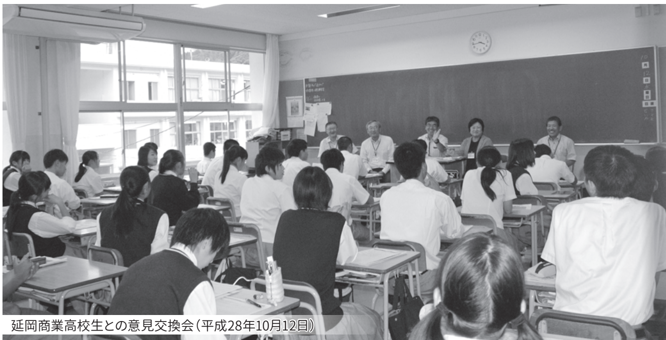
延岡商業高校生との意見交換会(平成28年10月12日)