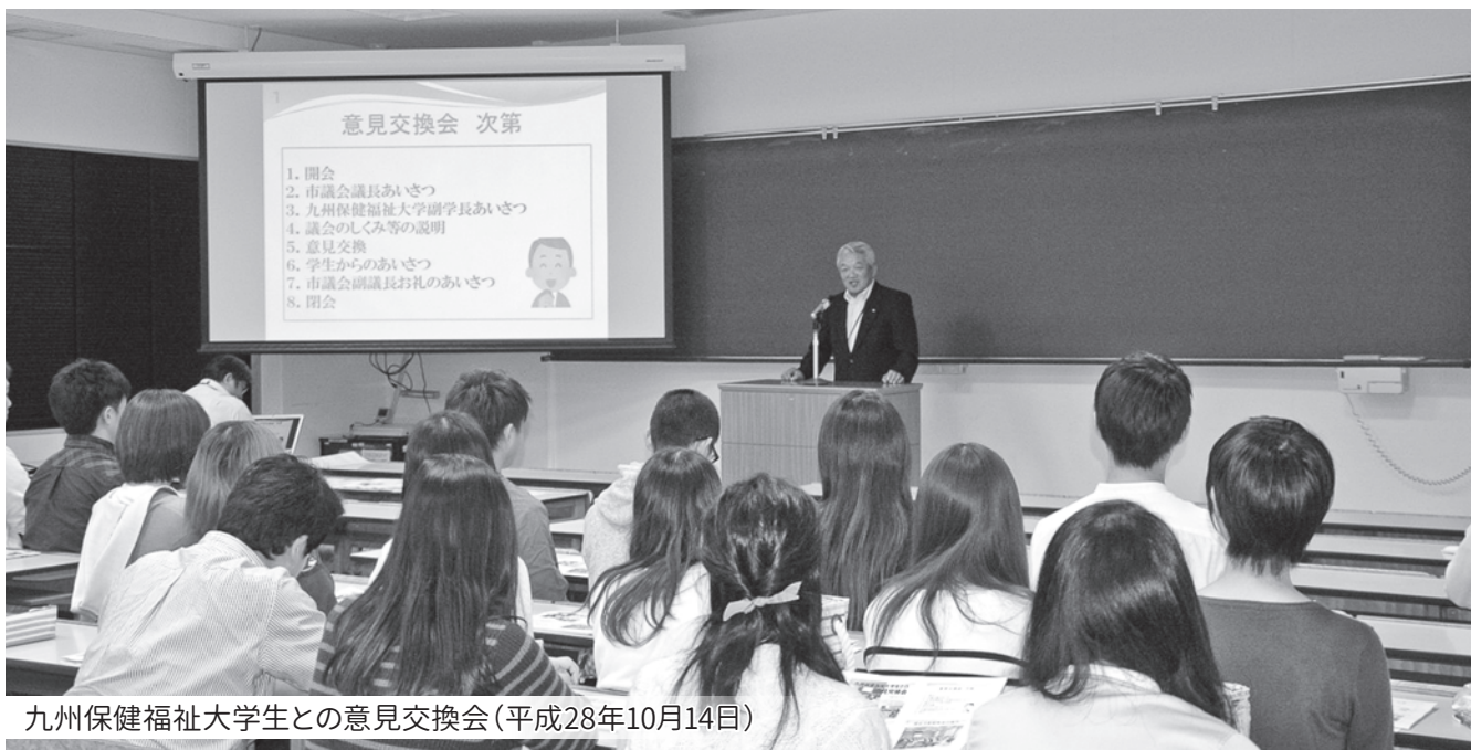
九州保健福祉大学生との意見交換会(平成28年10月14日)