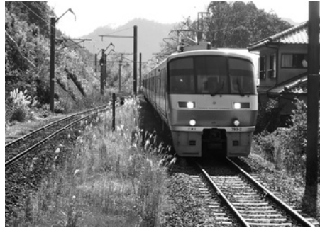
延岡-佐伯間を走行中の特急電車