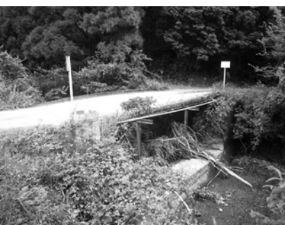
ねむの木団地の橋梁

【答】 現場打ちコンクリートによるボックスカルバートで整備し、平成30年度に完成させる計画である。