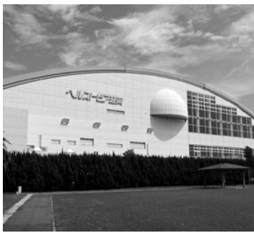
ヘルストピア延岡

【答】 都市計画道路は、ネットワークを形成しており、一部区間の廃止は、影響が大きいため、代替え道路を伴わない廃止は望ましくない。