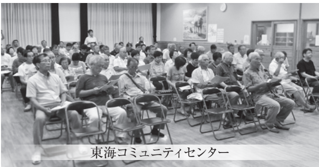
東海コミュニティセンター