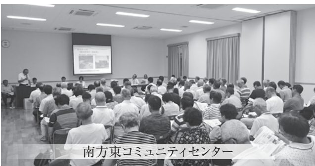
南方東コミュニティセンター

市議会では、議会基本条例に基づき、開かれた議会の一環として、議会活動の内容を広く市民の皆様理解していただくために、議会活動報告会を開催しています。 報告会では主に、各常任委員会が所管する事務調査の経過や、定例会での議案審査結果などを報告し、参加者の皆様と意見交換をします。 7月は、伊形地区・東海地区・岡富地区・南方地区・恒富地区の5地区で開催し、231名の方に参加していただきました。アンケート結果は下の表をご覧ください。