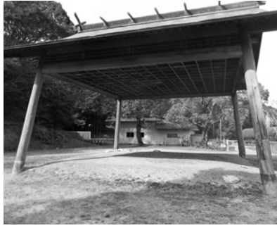
老朽化した相撲場

【答】 現在の相撲場は、解体撤去を考えている。今後は資材の再利用を含め、新設の可能性も併せて検討していきたい。