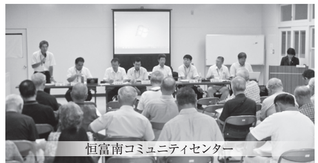
恒富南コミュニティセンター