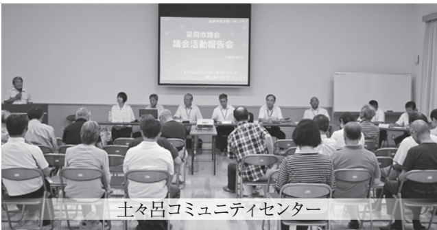
土々呂コミュニティセンター