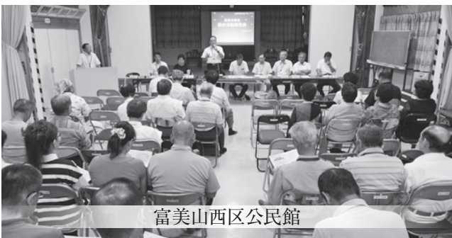
富美山西区公民館