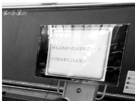
ICT教育で使用しているモニター

【答】 全学的な導入について、国の意向や研究指定校の成果を踏まえ、予算確保に努めながら計画的に整備を進め、児童生徒の「情報活用の実践力」を育成したい。