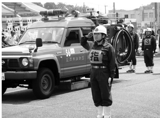
延岡市消防団 支団操法大会の様子