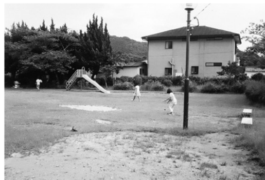
遊具の少なくなった公園