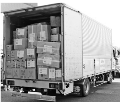
延岡市からの支援物資

この地震は、3日間で震度7から震度6弱が7回発生し、その度にながれる緊急地震速報と強い揺れに大きな不安を感じました。大地震は、全国どこでも起こり得ると考え、普段から今までの以上に防災・減災対策に取り組むとともに、災害から命を守る心構えをしておきたいと思えます。