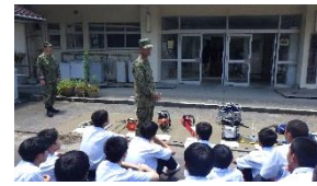
【人命救助セットです】