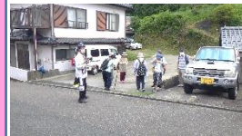
【一時避難場所に集合】

黒木会長があいさつした後、防災推進員による地震及び土砂災害の講話を受け、最後に非常持出品の確認を行い訓練を終了しました。