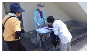
【暑さ対策バッチリよ】

非常に暑い中でしたが、徒歩で避難した北緑ヶ丘区の皆さんは、生徒とともに、第43普通科連隊第1中隊のレンジャー隊員による災害時を想定した人命救助訓練を見学した後、視聴覚室にて防災講話を受けました。延岡工業高校の生徒は、地震避難訓練や自衛隊訓練見学の後、リモート形式で学校周辺の危険見積りと地震・津波発生時の避難のあり方などについて学びました。