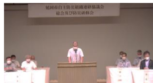
【森口会長あいさつ】