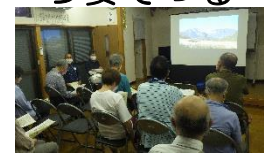
【雨の中に多くの参加者】