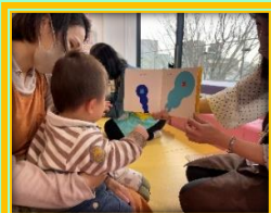
健康相談時の様子

7か月健康相談の合間に、赤ちゃんと保護者に向けてブックスタートを行います。ブックスタートや図書館でのおはなし会などについてお話した後、実際に赤ちゃんに絵本の読み聞かせを行います。「まだ小さいので読み聞かせはしていないんです」といった声も多く聞かれますが、実際に読み聞かせをしてみると、絵本に興味を持ち、前のめりになったり手を伸ばしたりする赤ちゃんの姿を直接見る事ができ、家庭でもチャレンジしてみようと前向きな言葉をいただくことが多いです。