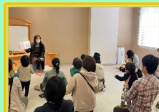
えほんのじかん (乳幼児向けおはなし会)の様子

忙しい毎日のなかでも赤ちゃんといっしょの大人が絵本を通じて心ふれあう時間を持つきっかけになることを願い、図書館はこの活動を続けていきたいと考えています。