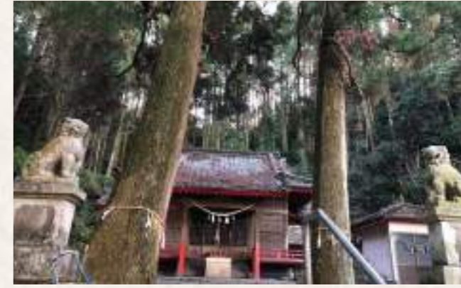
11 櫛津神社 住所：延岡市櫛津町 3515-1

延岡市土々呂町に鎮座する神社で、鹿児島霧島神宮の御分霊を移し祭っており、土々呂地区の氏神様として親しまれています。