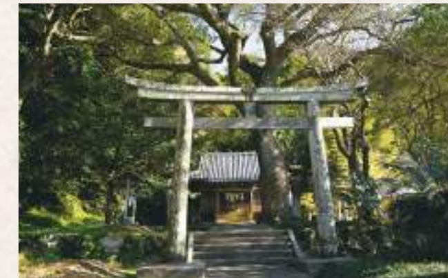
13 赤水神社 住所：延岡市赤水町 530-2

比叡大明神と称して鯛名の産土大神と尊崇されてきた社で、明治4年に当地字汐汲の稲荷神社、同字迫頭の金山神社、同字南山の恵比須神社等を合祀し、同年12月23日に旧来の社号であった比叡大明神を鯛名神社と改められました。