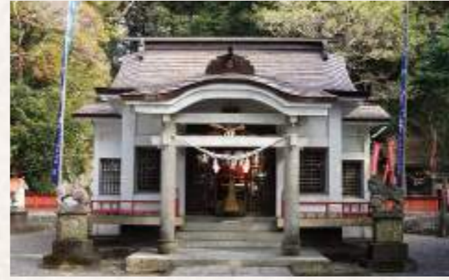
10 霧島神社 住所：延岡市土々呂町 5 丁目 1186

約600年程前に豊後の武将「与太夫 京五郎」が大友宗麟に追われた際に隠れ住んだ地とされ、病を治す神として信仰を集め、門前町の様な賑わいをみせたと言われていました。昭和40年頃から月命日の23日に供養が行われるようになり、現在は旧暦10月23日に大祭が行われています。