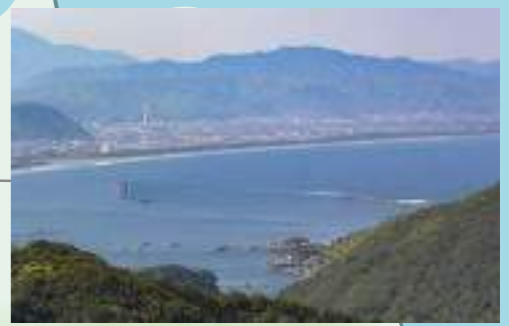
▲遠見山からの景色 春には1,000本の桜並木が咲き誇る