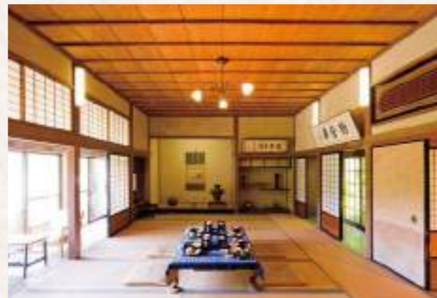
▲多くの調度品が展示される大広間