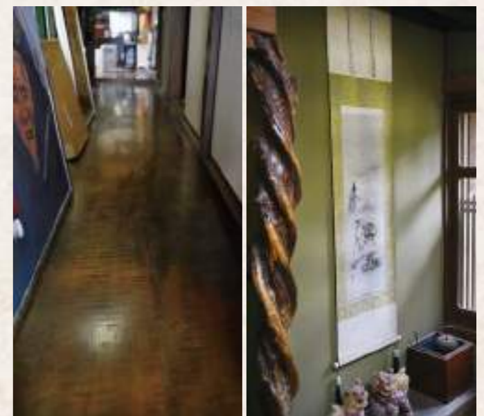
▲タモ材の一枚板貼りの床