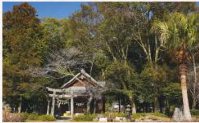
7 上伊福形神社 住所：延岡市上伊形町 892

神武天皇東征軍の先鋒を務めた天櫛津大久米命（アマクシツオクメノミコト）を祀る神社で、「櫛津町」はその名にちなんだものと言われています。明治4年神社改正の際、櫛津エンセキ山鎮座の天神社を合祀して、旧来の天神宮の社号を櫛津神社と改められました。