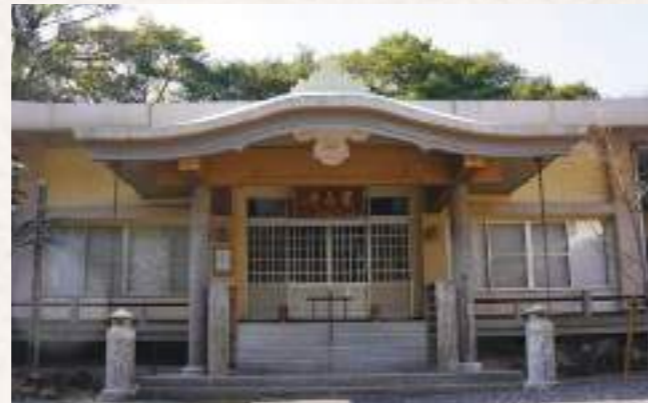
8 宝蔵寺 住所：延岡市上伊形町 615 電話：0982-37-7611

明治4年の神社改正で上伊福形村内の6社を合社して上伊福形神社と改称されました。伊福形神社とともに地域の氏神さまとして尊崇されている神社です。