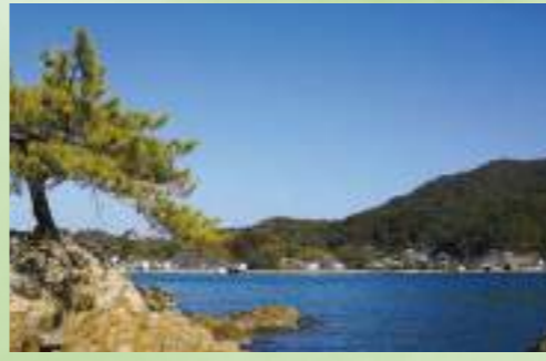
▲鯛名神社前より日高邸・赤水神社をのぞむ

市内の塩浜町・沖田町・大武町夏緑広葉樹のハマボウが優占する低本群落帯が帯状に生育しています。樹冠が密閉状態を形成するために林内の植物が生育しにくい、県内でも珍しいハマボウ群落です。同様の立地には、珍しいハマナツメ群落も見られます。