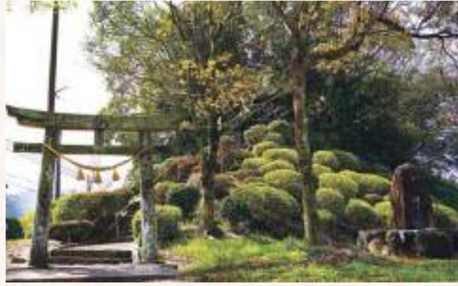
5 日枝神社 住所：延岡市石田町 3953 番地

伊形地区に伝わる宮崎県指定の無形文化財である伝統芸能「伊形花笠踊り」の発祥の地と言われる神社です。通称「おさんのんさん」と呼ばれており、毎年8月15日には神事が行われ、農村・農耕の無事を龍神に祈る「龍神祭」の行事の一つとして伊形花笠踊りが奉納されています。