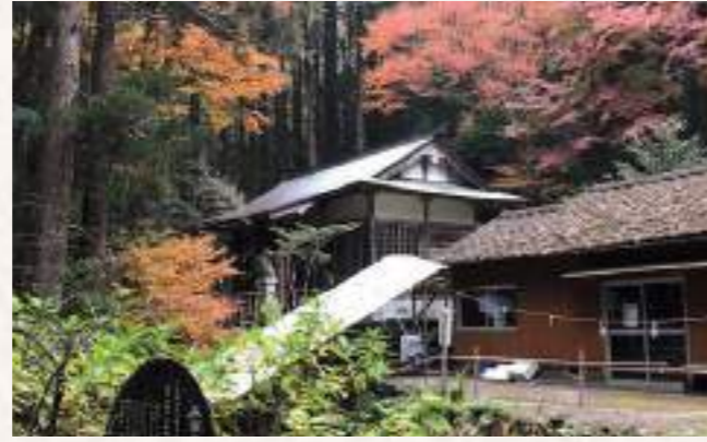
6 与太夫神社 住所：延岡市上伊形町黒原

伊形地区に伝わる宮崎県指定の無形文化財である伝統芸能「伊形花笠踊り」の発祥の地と言われる神社です。通称「おさんのんさん」と呼ばれており、毎年8月15日には神事が行われ、農村・農耕の無事を龍神に祈る「龍神祭」の行事の一つとして伊形花笠踊りが奉納されています。