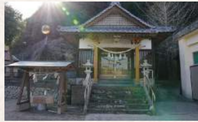
12 鯛名神社 住所：延岡市鯛名町 470-1

養老5(721)年建立の伊福寺が起源とされ、本尊に薬師如来が安置されています。同寺法灯が途絶えた後、応永20(1413)年に曹洞宗倉尾山宝蔵寺として開山されました。