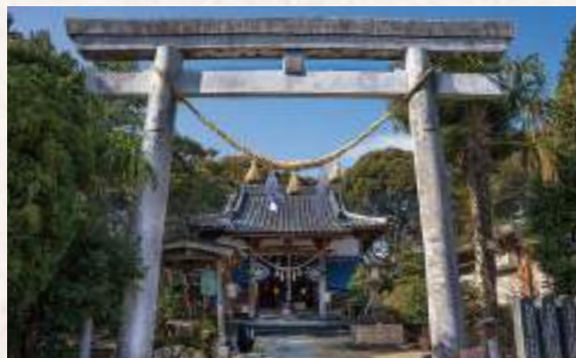
9 伊福形神社 住所：延岡市北一ヶ岡 4 丁目 11-12

往古より祭神菅原道真公を奉斎して天満宮と称し、赤水の産土大神と尊崇されてきた神社です。