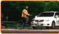
ダイジェスト篇 (約3分)