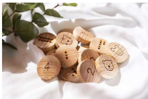
（製作した木のおもちゃ）