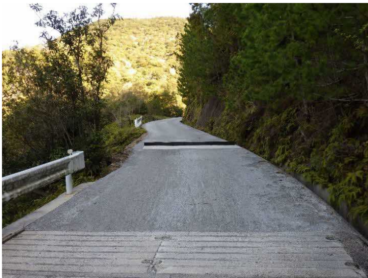
鉄鋼スラグ路面工