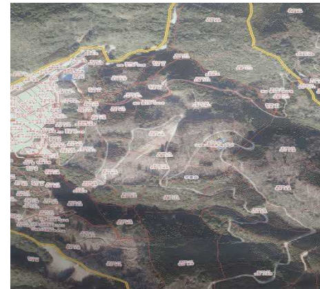
土地境界情報保全図