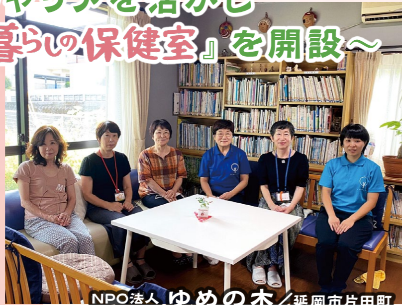
NPO法人 ゆめの木 / 延岡市片田町

令和元年11月に設立したNPO法人「ゆめの木」。医療、保健、介護、福祉の分野で長年キャリアを積んだ女性たちが、「退職後の自分たちにもまだ何かできないか?」「そうだ。暮らしに身近な保健室をつくらう。」と立ち上げました。個人の自宅の一角で、スタッフ10数名の少数精鋭が和気あいあいと活動しています。