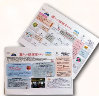
暮らしの保健室だより

地域の人が、本当に楽しみにしてくださるんですよ。「今度は何があるの」とか、「行くところがあって嬉しい」って言ってくださって。人間って評価していただくと嬉しいものですね。介護予防教室とか認知症カフェ（オレンジカフェ）もやれるようになって、ようやく軌道に乗ってきたところですね。