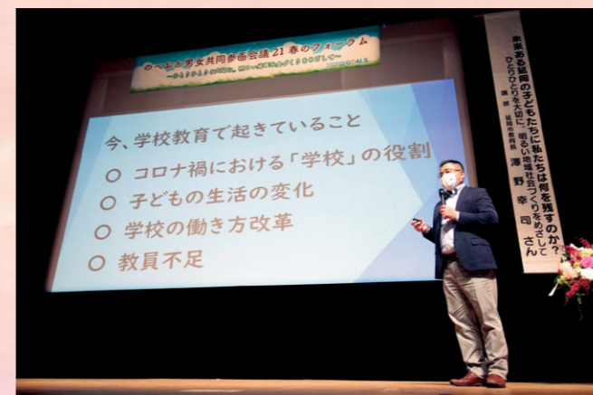
令和4年5月15日 澤野教育長講演会(21春のフォーラム)

わたしたちは、延岡に暮らすすべての人たちが共にいきいきと活動でき、喜びも責任も分かち合う「男女共同参画社会」の実現を目指し活動しています。あなたも一緒に活動しませんか？