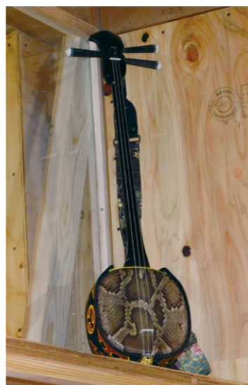
休日には子どもたちもアンプラグドへ。音楽やスポーツも大好き。(写真:愛用の三縁)

わたしが開いている人生会議では、少人数のグループに医療職の進行役を入れて皆に発言してもらっています。年代や医療職かどうかなどで価値観の違いが出て勉強になります。多様な職種の方が参加することで、ニーズを共有できたり、連携できたりしますし、立場の違う人たちがフラットに入り交じれる場が一番いいですね。これからも継続していきたいです。