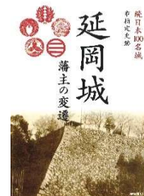
延岡城 藩主の変遷 パンフレット