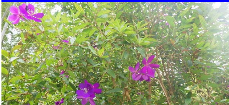
ノボタン(竹林横園路)