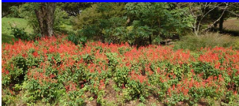
サルビア(第3花壇:上段)

延岡植物園では、第3花壇、第9花壇、第15花壇、OQPガーデン花壇に植えてあり、10月前半までが見頃です。