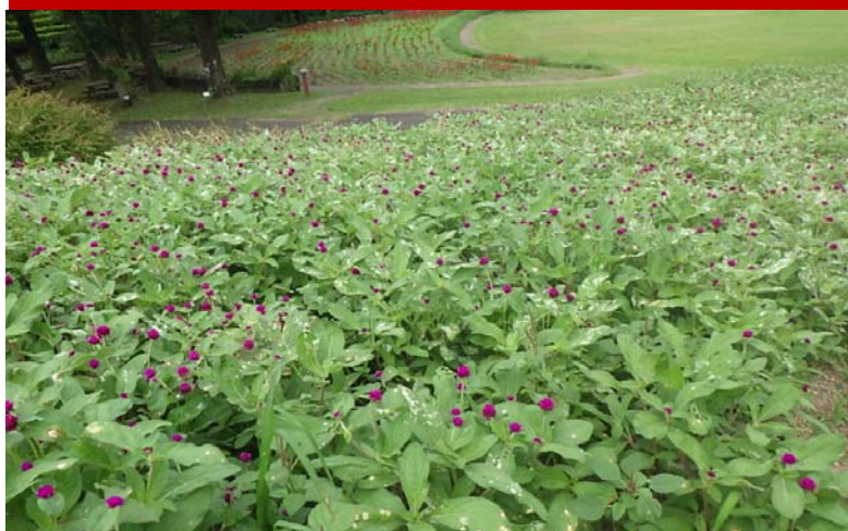
千日紅(第3花壇:下段)