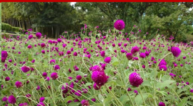
千日紅(オードリーパープルレッド)